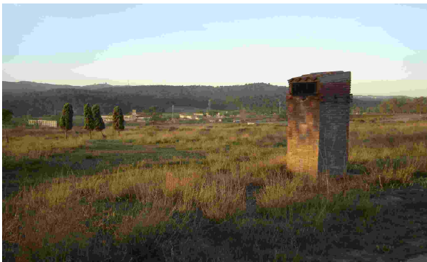
Xemeneies de gasos prop del cementiri