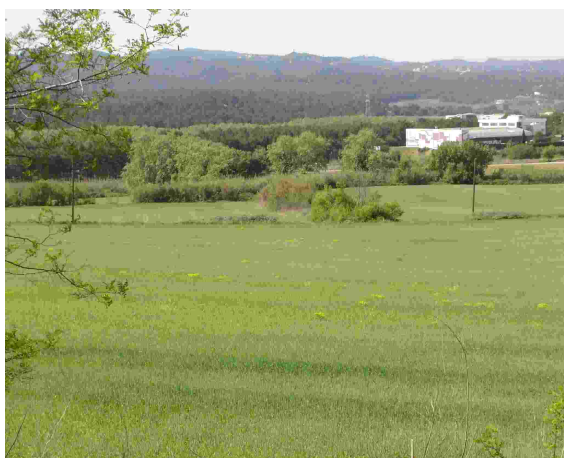
Dues formes de veure la Plana