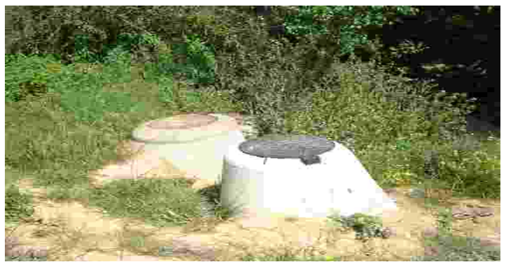
Connexió de les aigües contaminades a la xarxa municipal